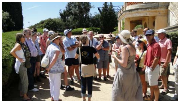
Visite guidée du Jardin.

Le visiteur peut choisir de se promener librement ou de suivre une visite guidée, sans supplément au prix d'entrée et accessible à tous. Une à quatre visites guidées sont proposées chaque jour. En 1h30, ces visites invitent à un tour du monde des paysages méditerranéens , à la découverte de l'histoire du Domaine, des plantes et de leurs secrets.