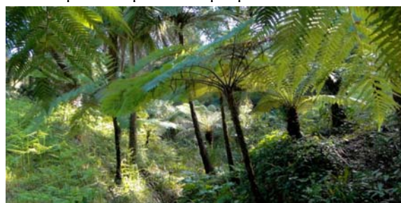
Jardin de Nouvelle-Zélande.

Mais il observe aussi des paysages issus des climats limitrophes au climat méditerranéen comme ceux des Jardins d'Amérique aride ou d'Amérique subtropicale, du Jardin d'Asie avec ses spectaculaires bambous ou encore les formations végétales à fougères arborescentes de Nouvelle-Zélande. Ces paysages exotiques ont pour base l'héritage de l'intérêt pour la botanique des premiers propriétaires.