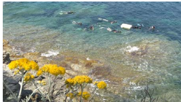
Sentier marin dans la baie du Figuier.

L'été, on peut également découvrir le jardin marin en combinaison, palmes, masque et tuba (dès 8 ans), sur inscription. Pour les plus jeunes, à partir de 4 ans, une activité « Les pieds dans l'eau » est praticable durant les vacances de printemps et d'été (sur inscription).