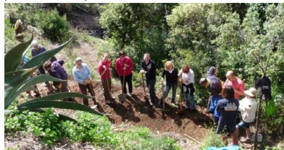
Atelier-formation en aménagement du jardin.

Depuis 2006, le Domaine du Rayol est agréé Organisme de formation par l'Etat, avec pour objectif la sensibilisation, la transmission et le partage des connaissances dans le domaine des plantes et du jardin.