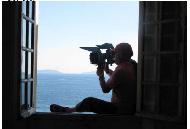
Tournage face à la Grande Bleue.

Il est également possible, pour les particuliers comme pour les entreprises, de louer des salles ou des espaces dans le Jardin pour la tenue de conférences, séminaires, tournages, prises de vue, etc.