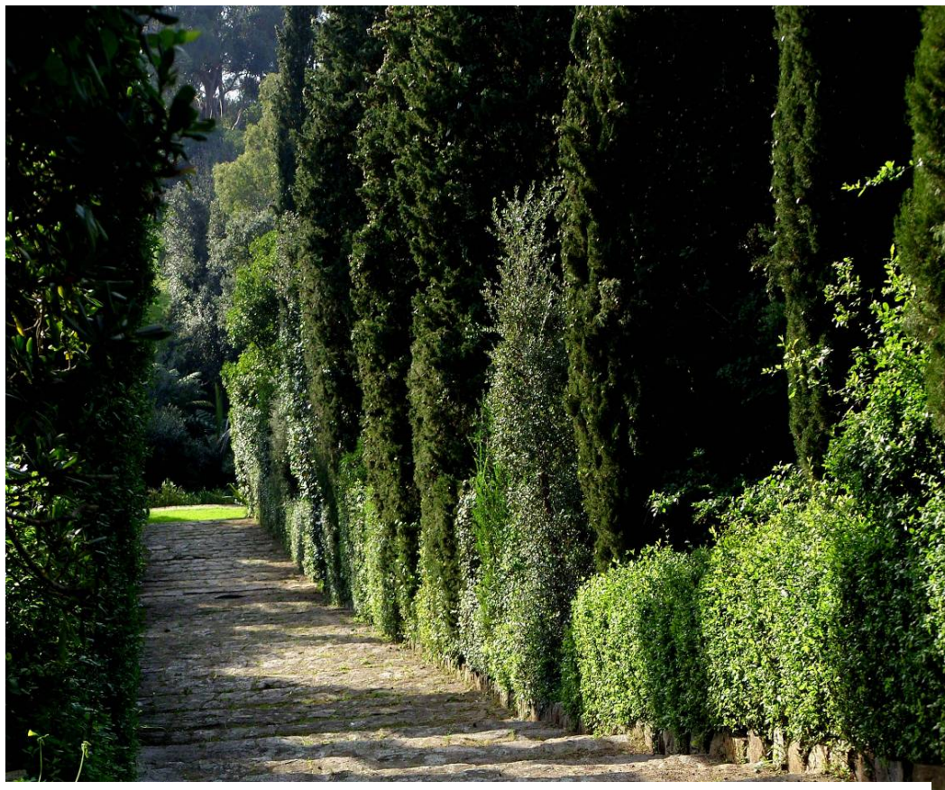
Descendre au jardin.

Le Domaine du Rayol, « territoire de nature et d'esprit » (Gilles Clément)