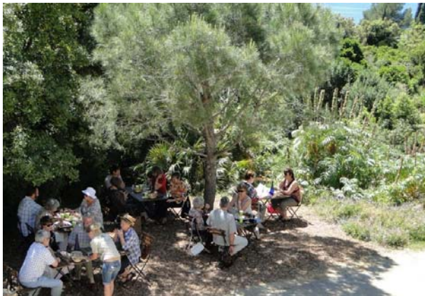
Pause gourmande au Café des Jardiniers.