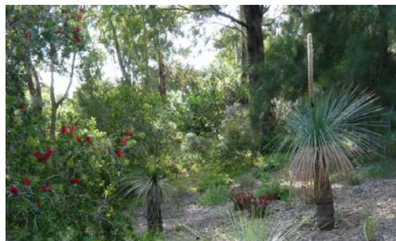
Jardin d'Australie.

Ainsi, le visiteur-voyageur se promène dans le fynbos d'Afrique australe, le matorral du Chili, le mallee et le kwongan d'Australie, le chaparral de Californie, le maquis et la forêt provençale, paysages caractéristiques du climat méditerranéen.