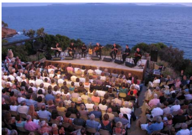
La Compagnie RASSEGNA

Les Soirées Romantiques (concerts de musique classique et méditerranéenne) ont lieu en plein air face à la mer, tous les lundis soirs de mi-juillet à mi-août.