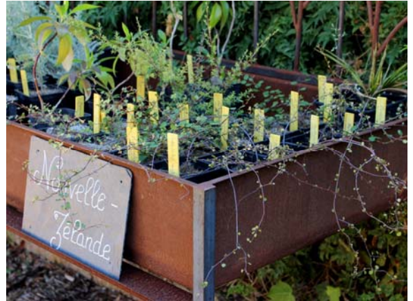
Une pépinière écologique.

Depuis 2009, la Pépinière du Domaine du Rayol propose les plantes emblématiques du Jardin des Méditerranées . Durable et désirable, elle a pour objectif de « produire sans épuiser » et se conforme pour cela à une charte : aucun intrant (pas d'engrais notamment), respect de la terre, du système racinaire et de l'équilibre des végétaux.