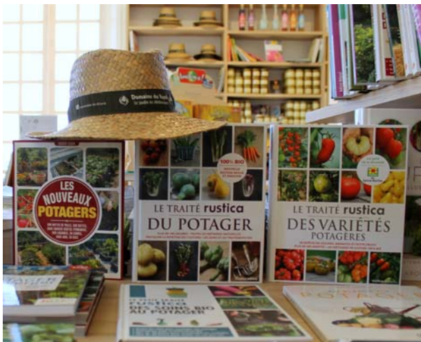
La Librairie des Jardiniers.

La Librairie des Jardiniers , forte de son fond de plus de 3 000 ouvrages, est spécialisée dans les domaines du jardinage, de la botanique, des usages des plantes, du paysage, de la protection de la nature et du littoral, de la Méditerranée... Le rayon jeunesse est particulièrement bien achalandé et permet de ravir les enfants dès leur plus jeune âge. La Librairie des Jardiniers est accessible indépendamment de l'entrée au Jardin.