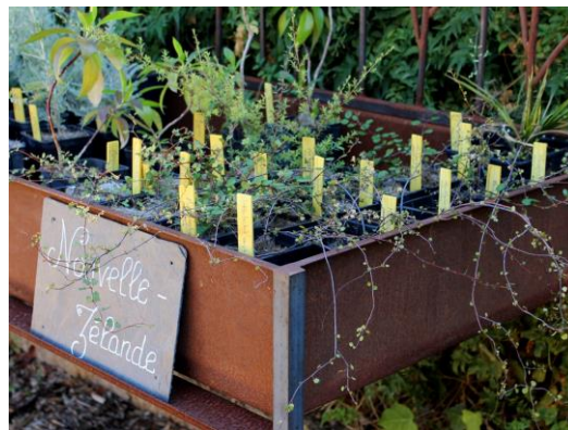
Une pépinière écologique.

Depuis 2009, la Pépinière du Domaine du Rayol propose les plantes emblématiques du Jardin des Méditerranées . Durable et désirable, elle a pour objectif de « produire sans épuiser » et se conforme pour cela à une charte : aucun intrant (pas d'engrais notamment), respect de la terre, du système racinaire et de l'équilibre des végétaux.