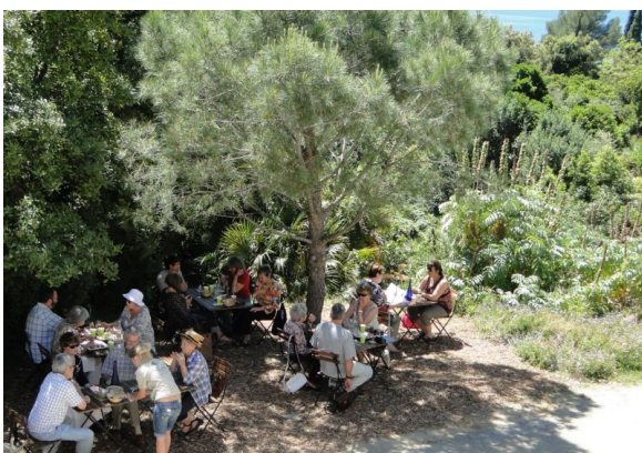
Pause gourmande au Café des Jardiniers.