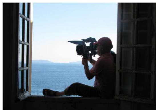
Tournage face à la Grande Bleue.

Il est également possible, pour les particuliers comme pour les entreprises, de louer des salles ou des espaces dans le Jardin pour la tenue de conférences, séminaires, tournages, prises de vue, etc.