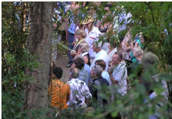
RDV au Jardin !

Le Domaine du Rayol participe également aux événements nationaux que sont les « Rendez-vous aux Jardins » le 1 er week-end de juin et les « Journées du Patrimoine » le 3 e week-end de septembre.