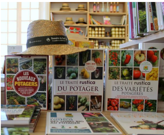
La Librairie des Jardiniers.

La Librairie des Jardiniers , forte de son fond de plus de 3 000 ouvrages, est spécialisée dans les domaines du jardinage, de la botanique, des usages des plantes, du paysage, de la protection de la nature et du littoral, de la Méditerranée... Le rayon jeunesse est particulièrement bien achalandé et permet de ravir les enfants dès leur plus jeune âge. La Librairie des Jardiniers est accessible, indépendamment de l'entrée au Jardin.