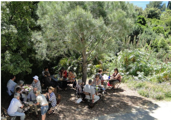
Pause gourmande au Café des Jardiniers.