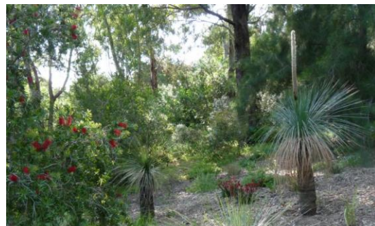
Jardin d'Australie.

Ainsi, le visiteur-voyageur se promène dans le fynbos d'Afrique australe, le matorral du Chili, le mallee et le kwongan d'Australie, le chaparral de Californie, le maquis et la forêt provençale, paysages caractéristiques du climat méditerranéen.