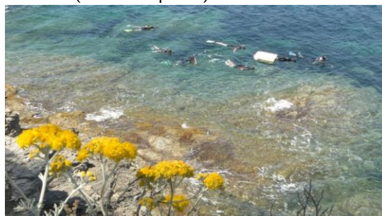
Sentier marin dans la baie du Figuier.

L'été, on peut également découvrir le jardin marin en combinaison, palmes, masque et tuba (dès 8 ans), sur inscription. Pour les plus jeunes, à partir de 4 ans, une activité « Les pieds dans l'eau » est praticable durant les vacances de printemps et d'été (sur inscription).