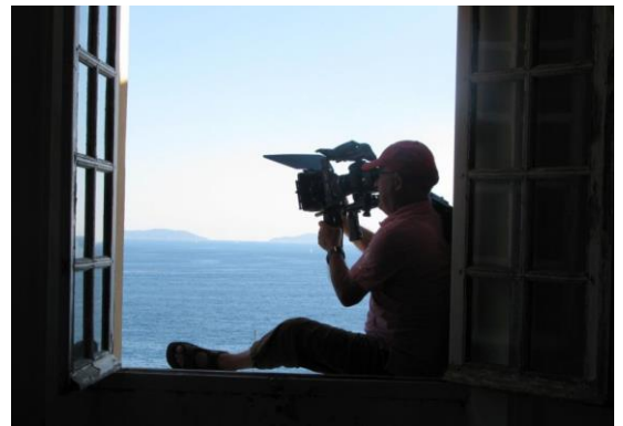
Tournage face à la Grande Bleue.

Il est également possible, pour les particuliers comme pour les entreprises, de louer des salles ou des espaces dans le Jardin pour la tenue de conférences, séminaires, tournages, prises de vue, etc.