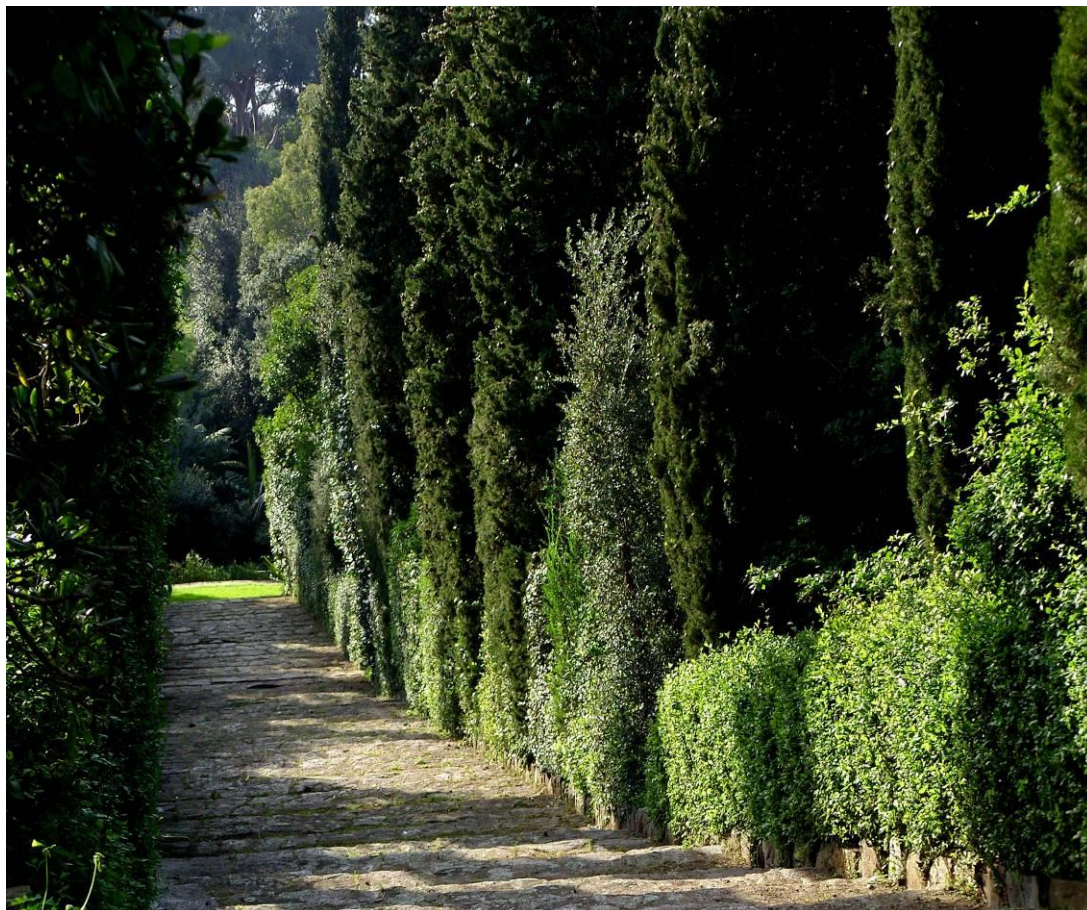
Descendre au jardin.

Le Domaine du Rayol, « territoire de nature et d'esprit » (Gilles Clément)