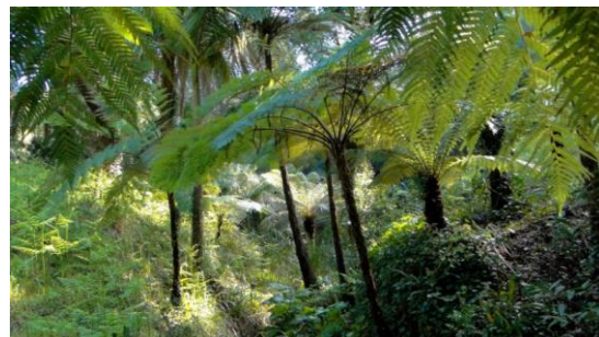
Jardin de Nouvelle-Zélande.

Mais il observe aussi des paysages issus des climats limitrophes au climat méditerranéen comme ceux des Jardins d'Amérique aride ou d'Amérique subtropicale, du Jardin d'Asie avec ses spectaculaires bambous ou encore les formations végétales à fougères arborescentes de Nouvelle-Zélande. Ces paysages exotiques ont pour base l'héritage de l'intérêt pour la botanique des premiers propriétaires.