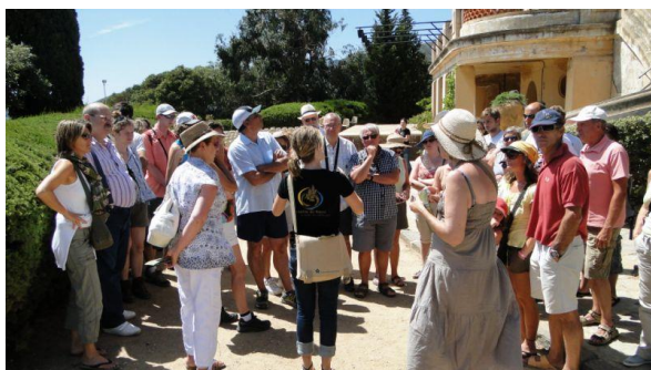
Visite guidée du Jardin.