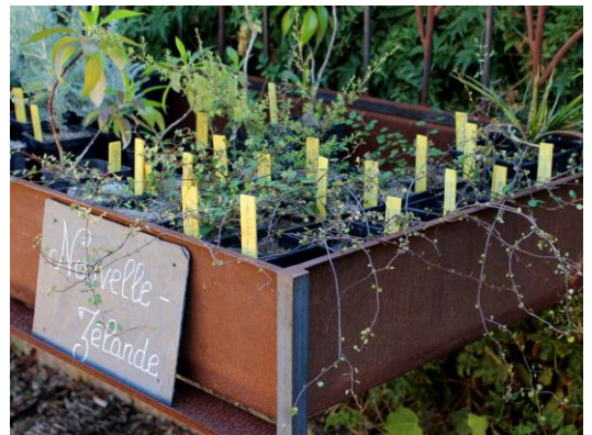
Une pépinière écologique.

Depuis 2009, la Pépinière du Domaine du Rayol propose les plantes emblématiques du Jardin des Méditerranées . Durable et désirable, elle a pour objectif de « produire sans épuiser » et se conforme pour cela à une charte : aucun intrant (pas d'engrais notamment), respect de la terre, du système racinaire et de l'équilibre des végétaux.