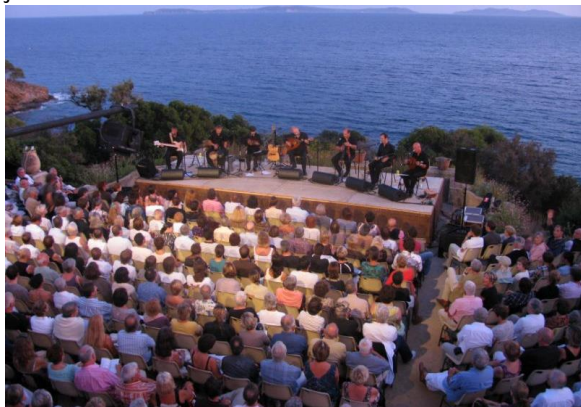
La Compagnie RASSEGNA

Les Soirées Romantiques (concerts de musique classique et méditerranéenne) ont lieu en plein air face à la mer, tous les lundis soirs de mi-juillet à mi-août.